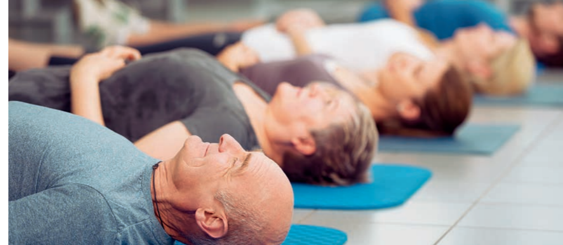
Was tut mir gut? Herausfinden, was hilft! Mit einer ganzheitlichen Therapie durch integrative Module wird die mentale Stabilität verbessert, werden Nebenwirkungen erleichtert und die inneren Kraftquellen aktiviert.